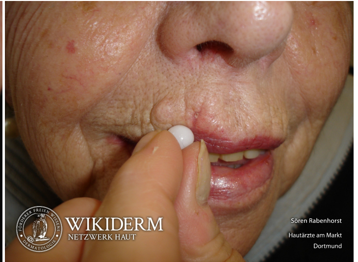
Fremdkörper, Oberlippe, Abb. 3

Sören Rabenhorst Hautärzte am Markt Dortmund