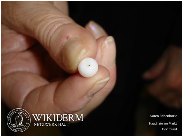
Fremdkörper, Oberlippe, Abb. 4