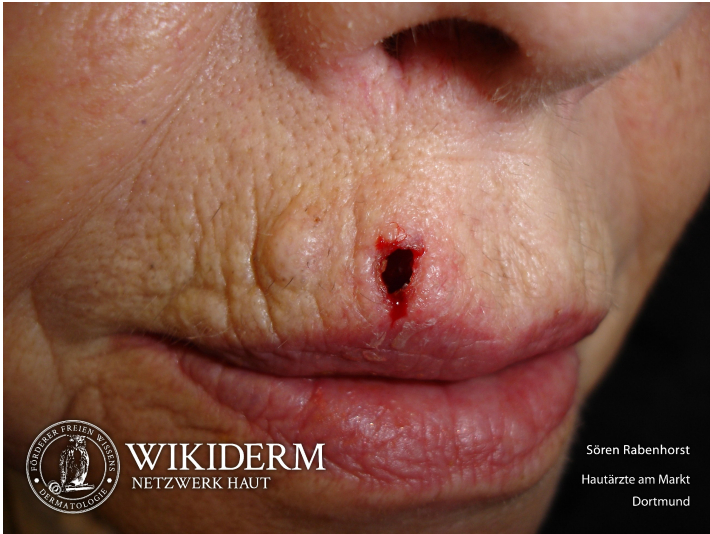
Fremdkörper, Oberlippe, Abb. 2